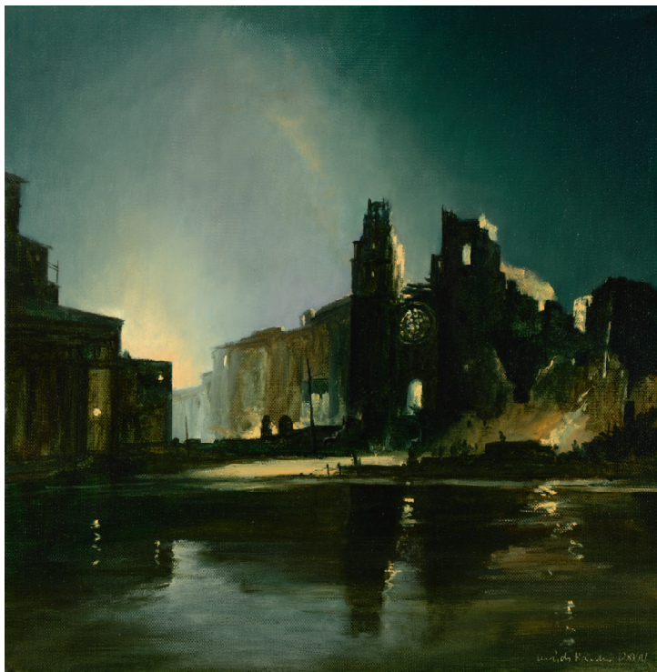
Ulrich Harder, VISION, 2018, Öl auf Leinwand, 40 × 40cm

Ulrich Harder Bunter Kitzel 1 35037 Marburg